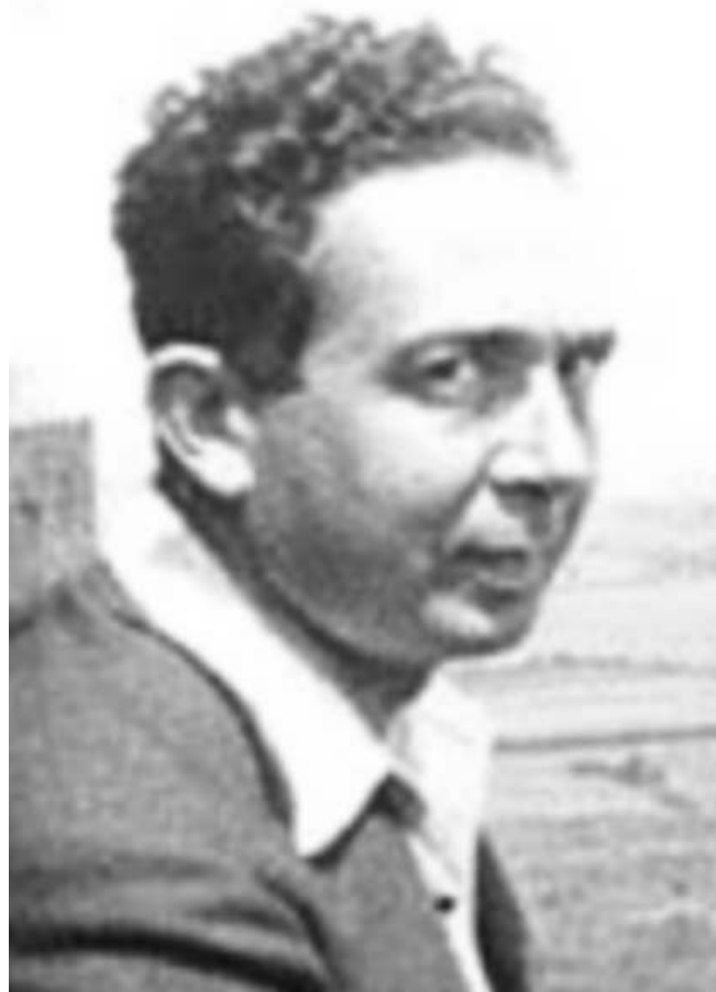
Figura 1. Leo Szilard (1898-1964), originario de Budapest-Hungría y naturalizado estadounidense, fue un físico cuya fama se debe principalmente a su rol en el diseño de la bomba atómica, aunque también cuenta con contribuciones importantes en los campos de la termodinámica y la biofísica. Siendo joven se interesó ya por los inventos prácticos, de donde surgió la colaboración con Einstein en torno al diseño de refrigeradores; posteriormente habría de inventar métodos para la separación de isótopos, así como para lograr una reacción nuclear en cadena. Huyó de Alemania cuando Hitler llegó al poder en 1933, pasando por Viena y Londres; a partir de 1937 se estableció en los EUA, primero en la Universidad de Columbia y luego en la Universidad de Chicago, donde colaboró con Enrico Fermi en el desarrollo del primer reactor nuclear. En 1946 asumió la cátedra de biofísica en la misma universidad. Después de la explosión de las primeras bombas atómicas en Japón, Szilard encabezó movimientos para el uso pacífico de la energía nuclear, por lo que en 1959 recibió el premio “Átomos por la Paz”.

Después de varios diseños y pruebas, se obtuvo finalmente un invento que resultó ser exitoso y revolucionario: