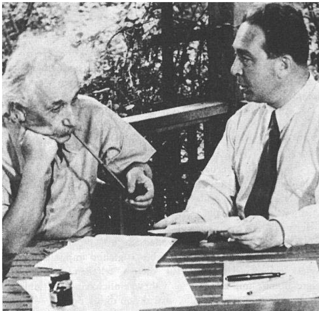
Figura 3. Leo Szilard en ocasión de una visita al hogar de Einstein.